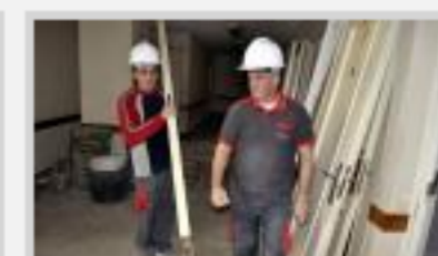
Sanidad inicia las obras del centro de salud