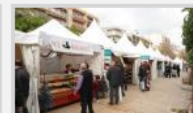
Los comercios salen a la calle