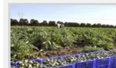
El dispositivo especial de seguridad en el campo y