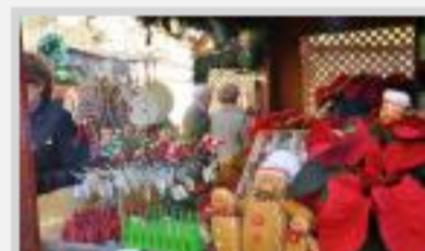
Feria navideña en la plaza Santa Isabel