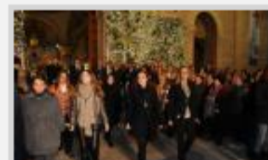
Los torrevejeneses agasajan a su patrona sobre una