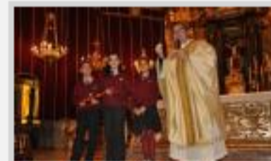
Misa dedicada a la Virgen de la Asunción del compo