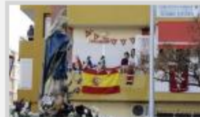
Procesión de la inmaculada en Alicante