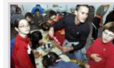
Jornada de convivencia en el Centro Tamarit de Elc