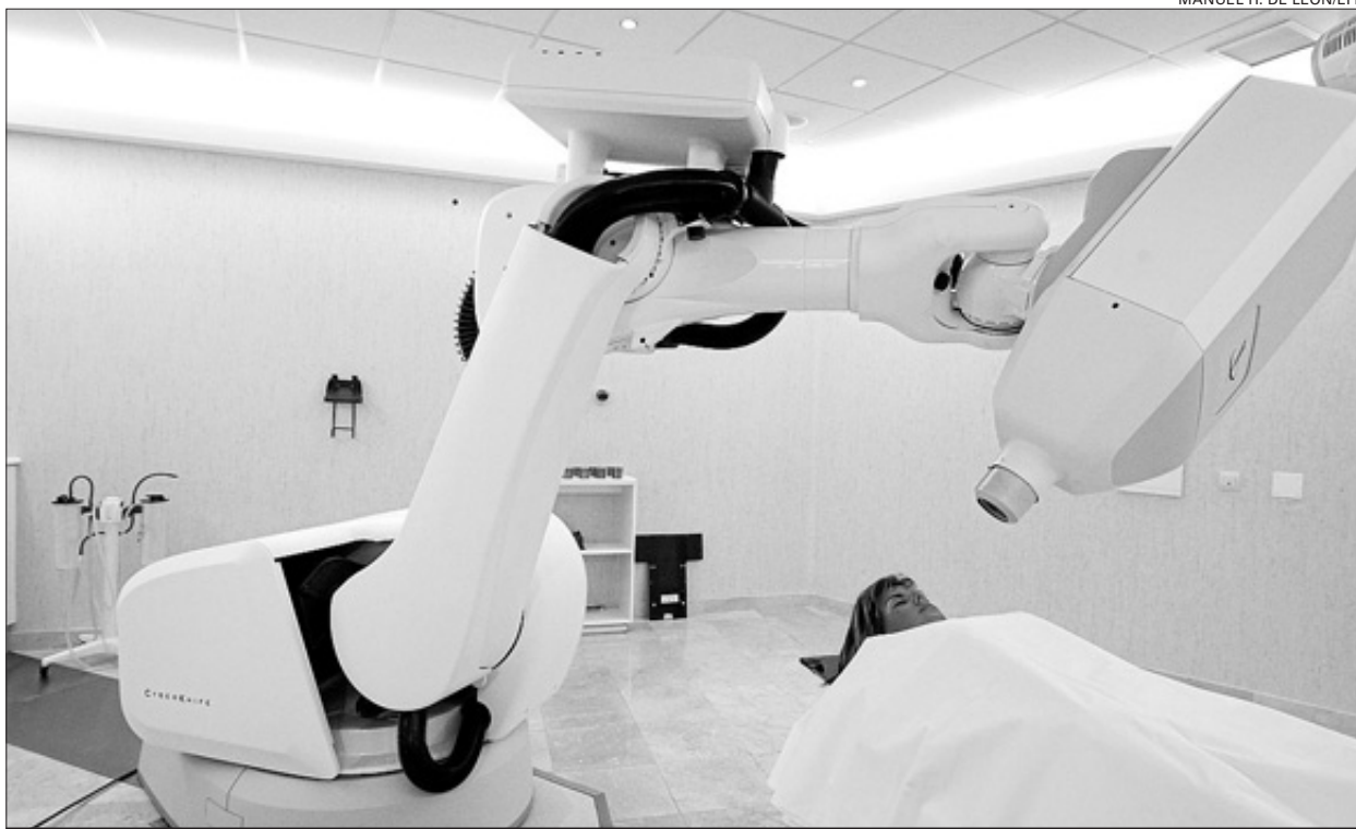
Una paciente es tratada por el «Cyberknife», el primer aparato de radiocirugía robótica, en el Hospital Ruber Internacional

La instalación completa del «Cyberknife» —en manos aún del ámbito privado, aunque el Ruber Internacional mantiene conciertos con la Sanidad pública—, supone una inversión aproximada de seis millones de euros.