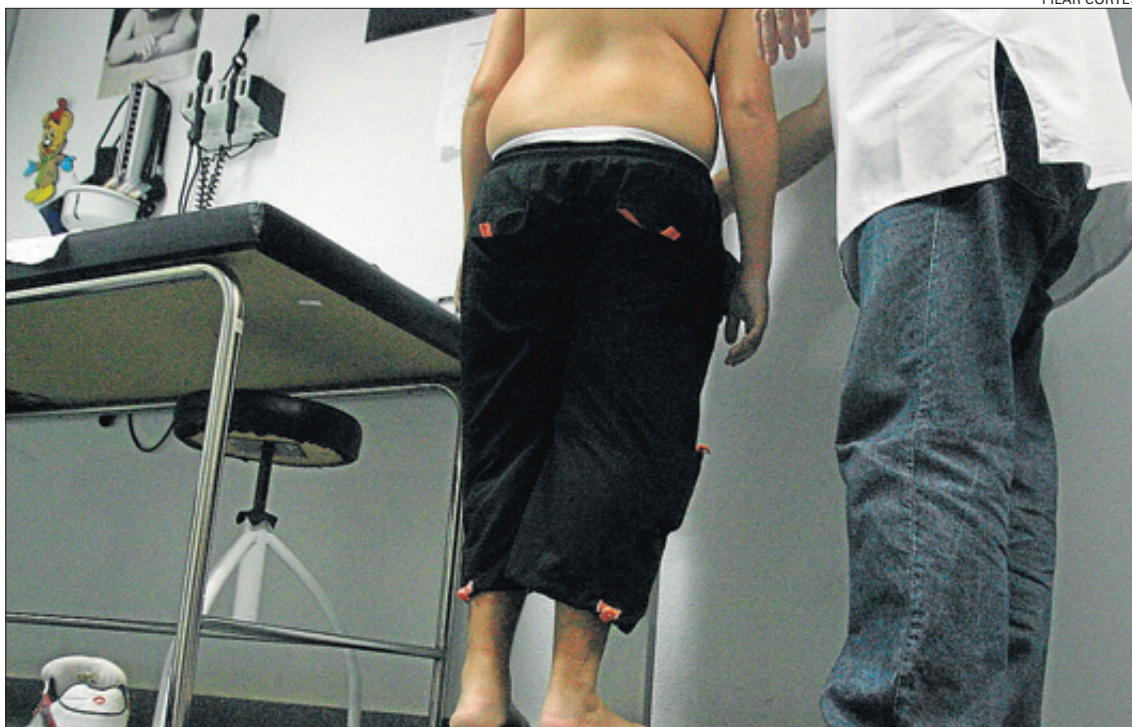
Pesaje y medición de un adolescente en un centro de salud de Alicante

Según el trabajo realizado, hay una tendencia creciente al sobrepeso y a la obesidad, sobre todo en la población masculina