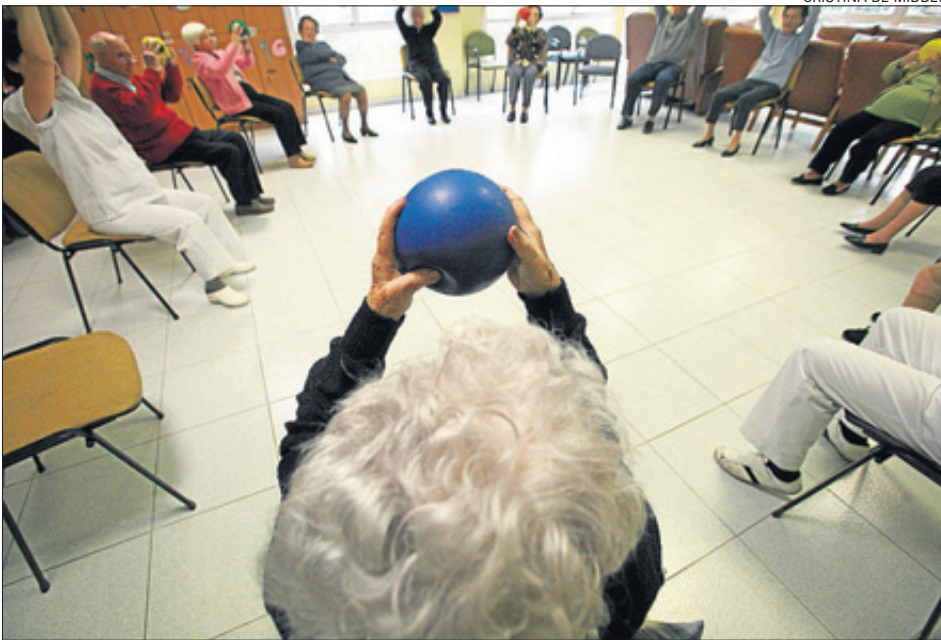
Imagen de archivo de un taller de un centro de día para enfermos de Alzheimer en Alicante