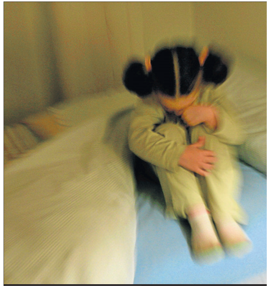
Es una enfermedad genética que puede detectarse por las repercusiones que tiene en la

teria en varias versidades, es opinión de que fundamentalmente las pruebas clínicas y los tratamientos deben ser globales y multidisciplinarios, ya que los niños que comienzan la terapia con medicación y psicoterapia obtienen mejores resultados. Trabajamos con sus síntomas de atención, memoria y d