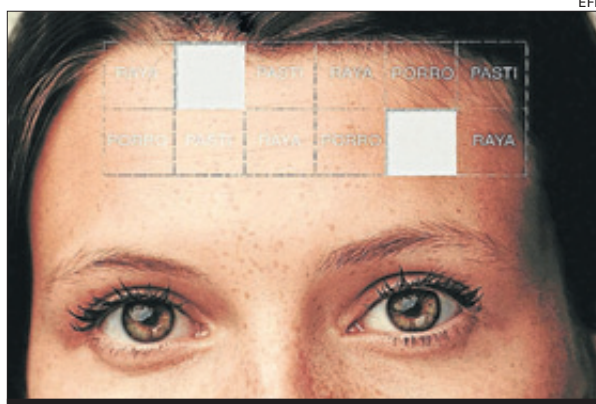
Imagen de archivo de un cartel contra la drogadicción

ción o abstinencia a través de la historia clínica, la exploración física o de análisis toxicológicos en orina o sangre. Una vez iniciados los síntomas psicóticos pueden durar hasta cuatro semanas después del abandono de la sustancia. Los trastornos psicóticos inducidos por sustancias sólo se producen en asociación al consumo de éstas, mientras que los trastornos psiquiátricos primarios pueden preceder al inicio del consumo de la sustancia o producirse tras largos periodos de abstinencia.