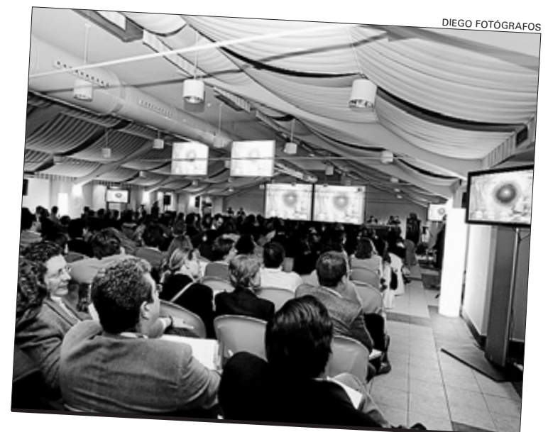
La reunión Faco Elche se celebrará en el hotel Huerto del Cura de Elche

El origen de las cataratas no se conoce, a pesar de que en ciertos casos se producen debido a la exposición a los rayos X o a la luz solar muy intensa, a ciertas enfermedades oculares inflamatorias, a algunos fármacos (como los corticosteroides) o como una complica-