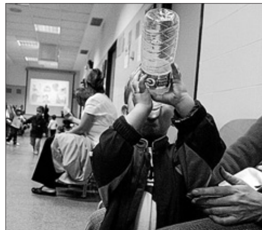
Niños esperando en una consulta de pediatría

tidades de suero que debe de tomar y el intervalo adecuado entre cada una de ellas. Si esto no se respeta, no sirve para nada e incluso puede perjudicar aún más al afectado». El doctor García establece que, por ejemplo, para un bebé de unos 9 kilos de peso, la dosis a tomar sería 30 cms, de suero de rehidratación cada media hora —si está despierto—, ó 120 cms cada 2 horas si está dormido. «En ocasiones los padres dan más de lo que pueden admitir, cosa que no ayuda para la recuperación del pequeño», dice el